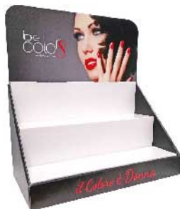
BCEBC.S ESPOSITORE DA BANCO in cartone con 2 ripiani

Be colors propone due soluzioni di espositori da banco per smalti Be Colors soak off.