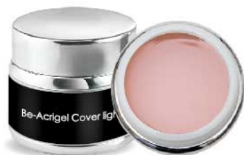
BE-ACRIGEL COVER LIGHT BC262 30 ml