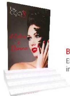
BCEB.S ESPOSITORE DA BANCO in forex con 28 fori