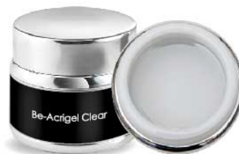
BE-ACRIGEL CLEAR BC261 30 ml