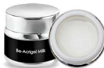
BE-ACRIGEL MILKY BC260 30 ml

Specifico per ricostruire lunghezze importanti e coperture su unghie che tendono a spezzarsi facilmente.